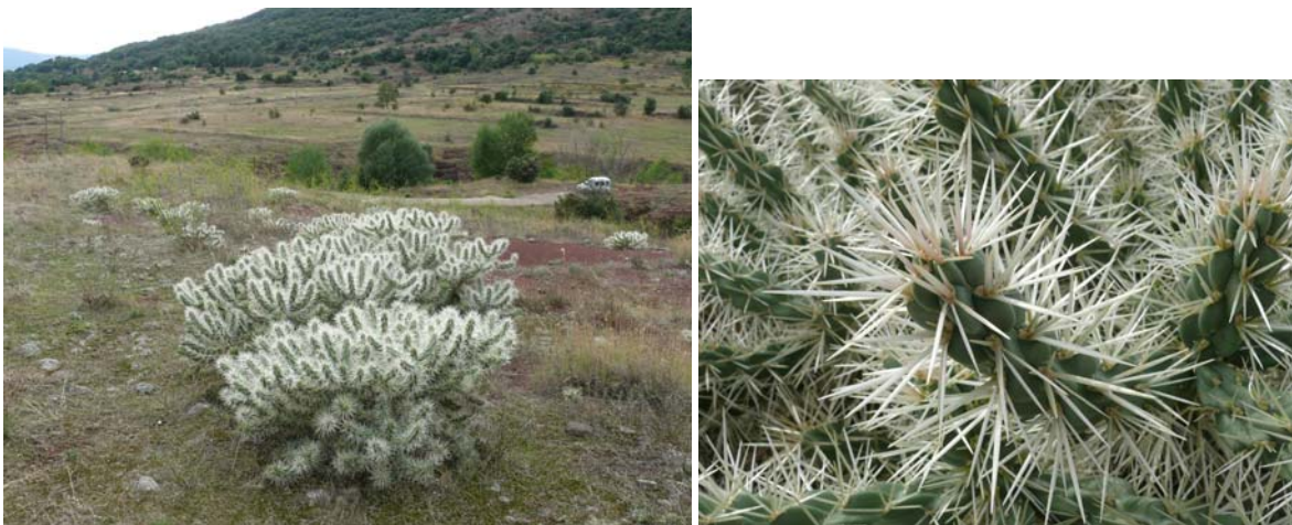
Figure 1 : Opuntia rosea à Celles (population, détail des épines)

Les fruits sont vers l'apex et font 2-4.5 cm de long. Les vieux fruits ont moins d'épines que les jeunes (Figure 1).